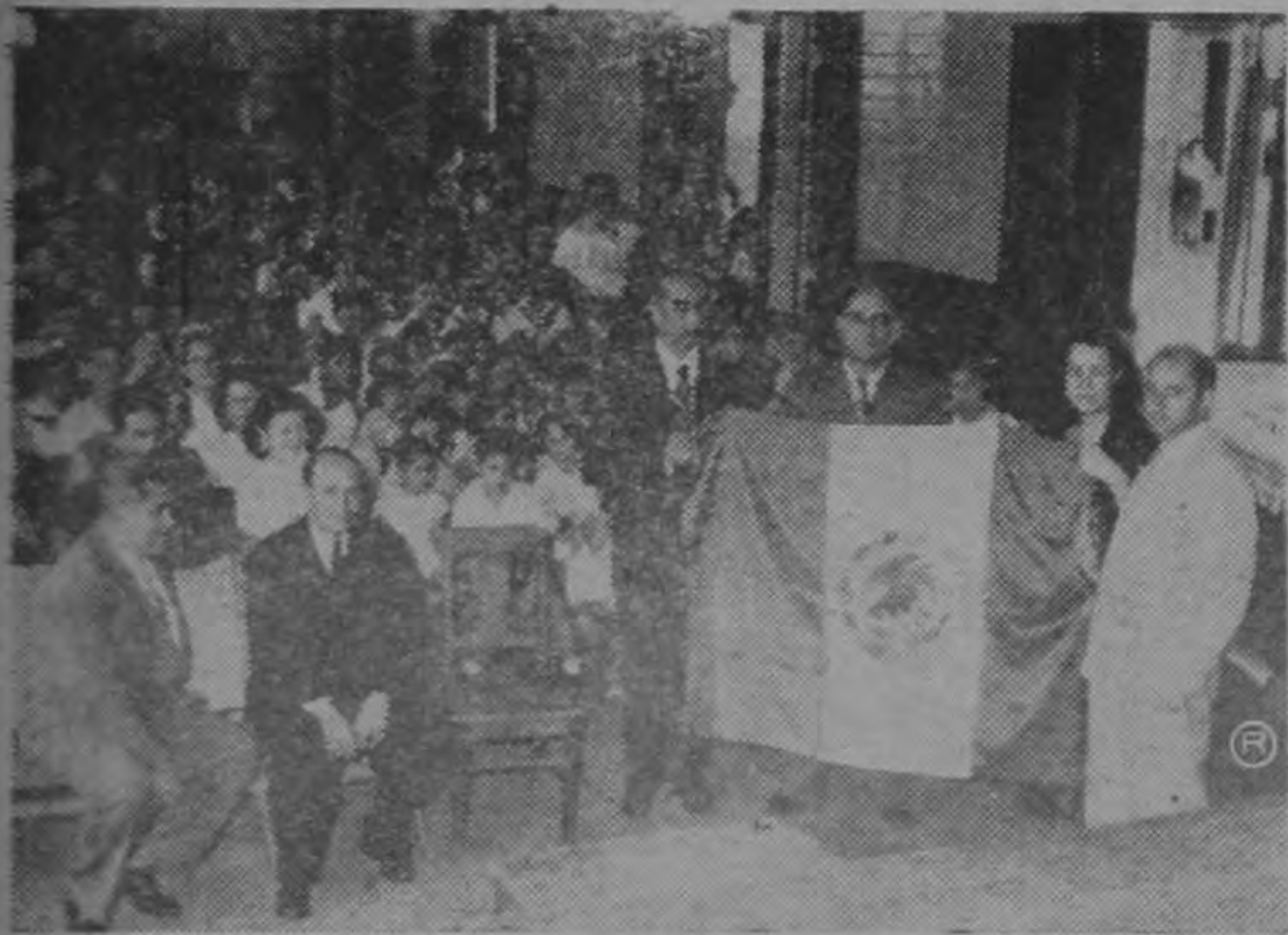
Profesores mexicanos que nos visitan hacen entrega de una bandera obsequiada por la Secretaría de Educación de su país, a la Escuela "República de México".

Temperatura mínima en San José, alrededor de los 16° y la máxima alrededor de los 28°C.