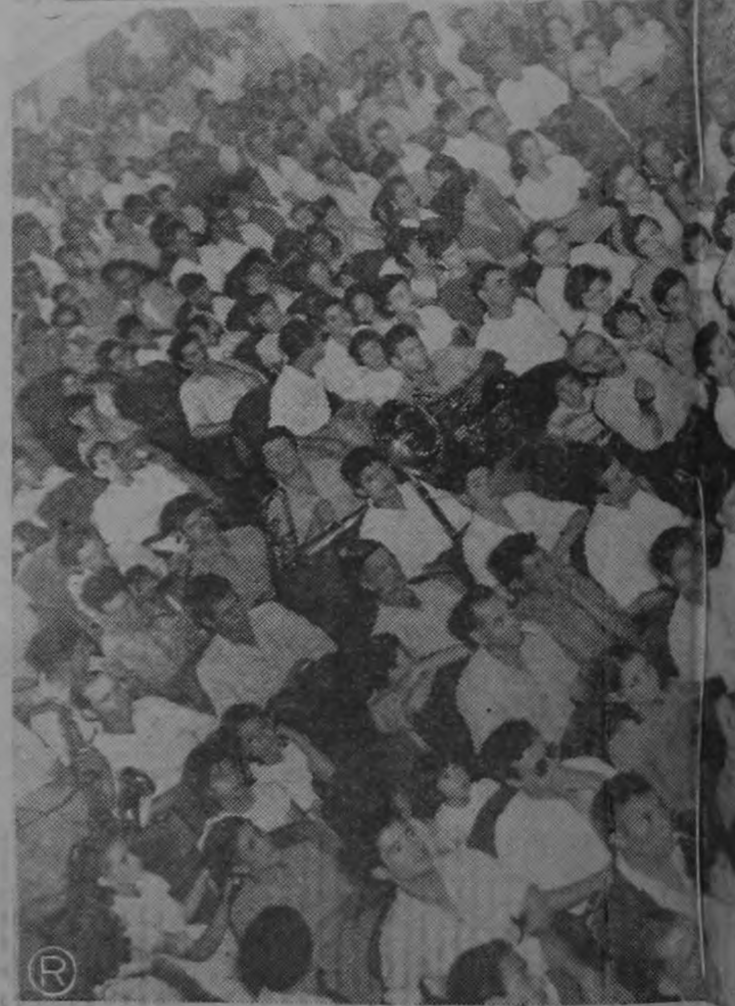
Dos aspectos parciales que dan una idea de la muchedumbre