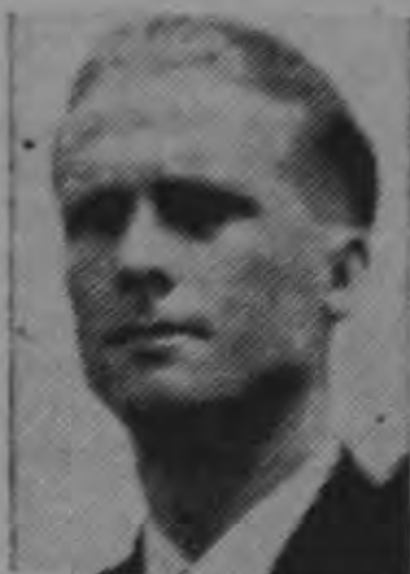
Fernando Vargas Vuelve a la carga

Continúa el debate sobre la reforma al artículo 132 de la Constitución Política sobre elección de ex-Presidentes de la República.— Se espera que la admisión del proyecto sea votada en la sesión de hoy.— Aprobado dictamen favorable a reformas propuestas a la Ley de Construcciones