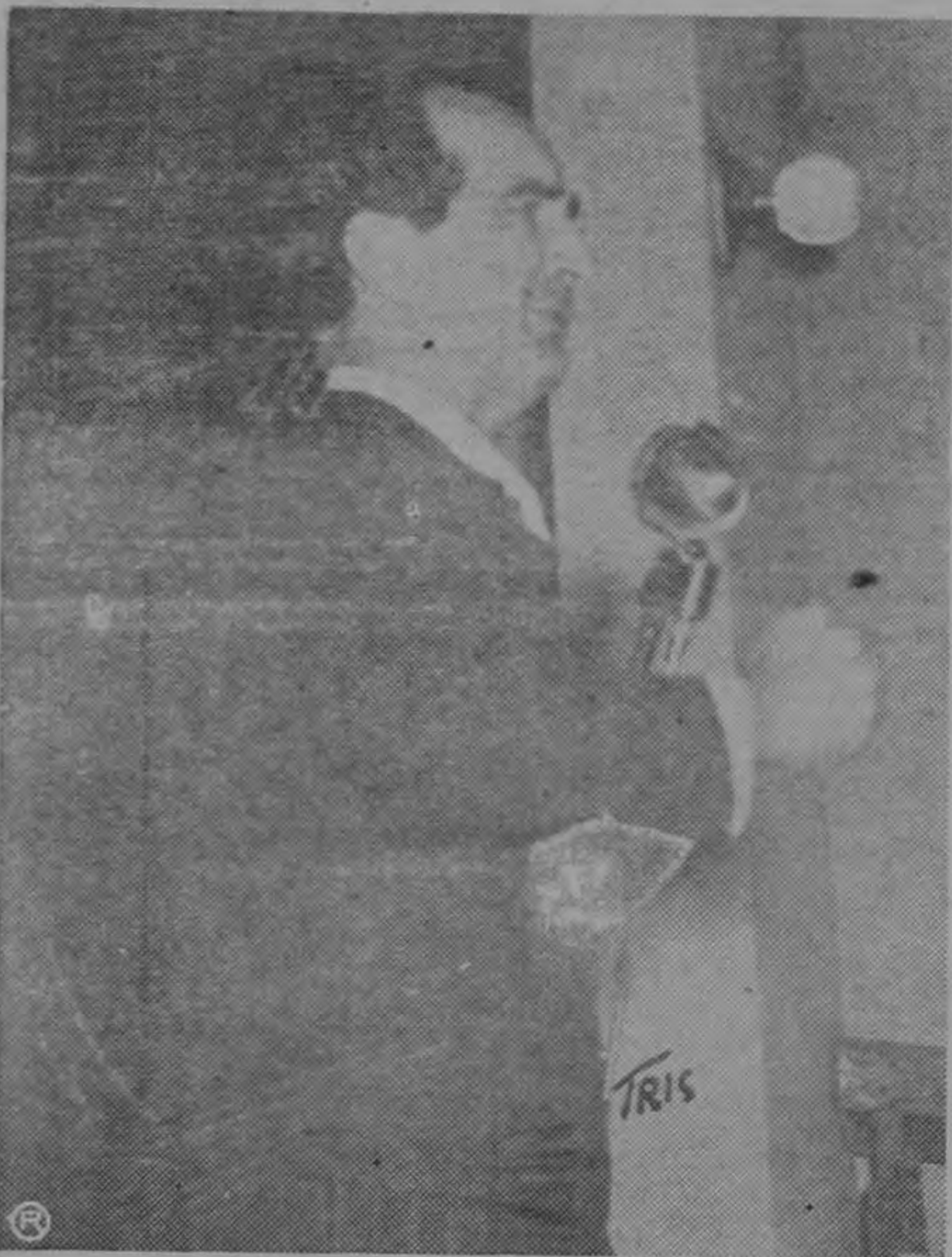
Ayer nuestros adversarios nos combatieron con black-jack, hoy nos combater con mentiras, mentiras que los pueblos no creen! Dijo Figueres

cional, que encabeza don José Figueres, obedece a la convicción profunda de que