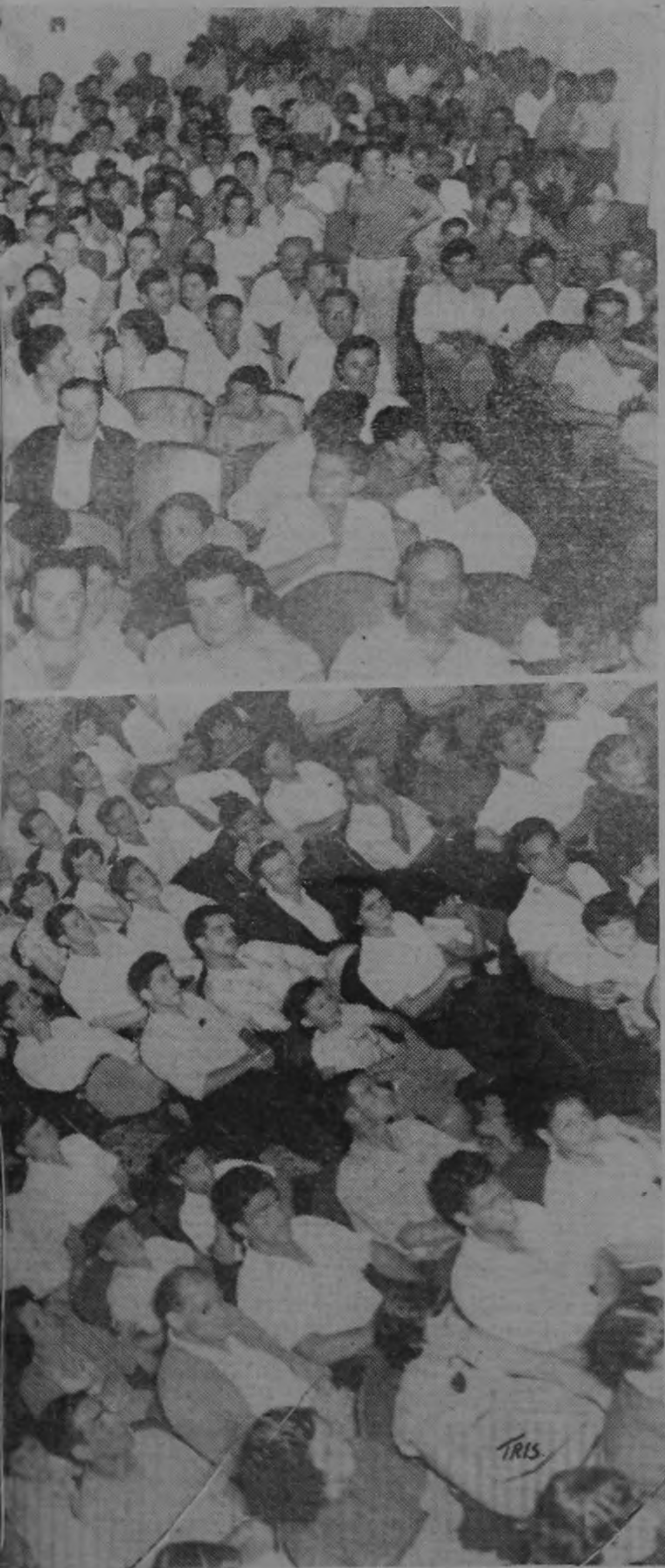
nu trida concurrencia que llenó el Teatro Paraíso.

o el Partido Liberación Na- taforma ideológica concreta, n cional, está ofreciendo al un análisis serio y profundo elctorado del país, una pla- de los problemas nacionales