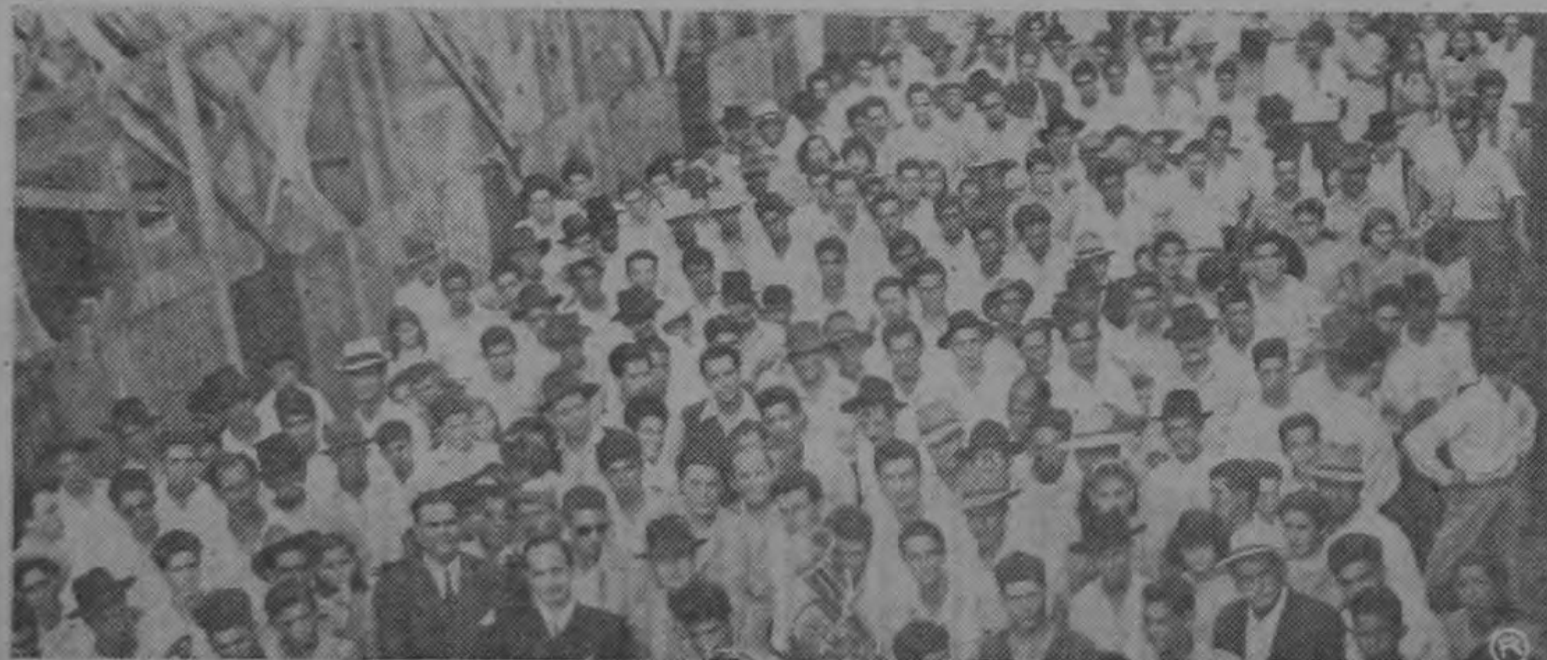
Parte de la muchedumbre que acompañó a Figueres por las calles de Paraíso.