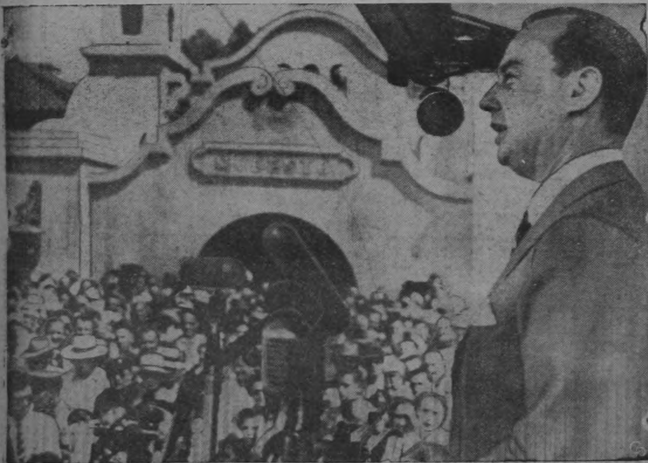
Creciente buen éxito están teniendo las actuaciones públicas que se realizan en el curso de la gira que realiza el candidato demócrata Adlai Stevenson. Aparte de que la personalidad del candidato ha ido definiéndose cada vez mejor, ha contribuido mucho a galvanizar su campaña la acusación lanzada contra el senador Dixon, candidato a la Vicepresidencia por los republicanos, lo que viene a neutralizar el tema de la inmoralidad administrativa que era esgrimido por los partidarios de Eisenhower.